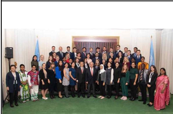
안토니오 구데흐스 사무총장과의 기념사진 촬영