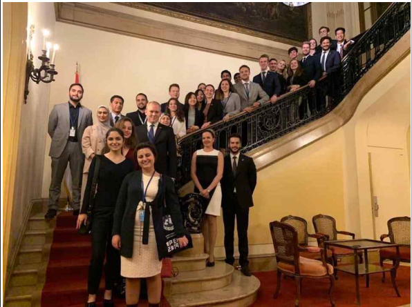
세르비아 YD 사이드 이벤트