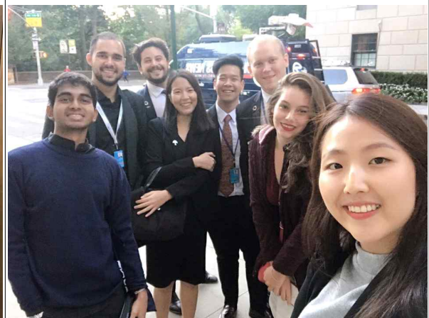
세계 여러 YD들과의 사진