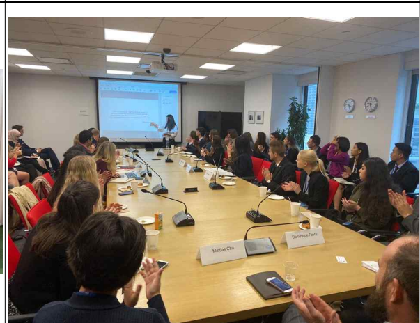
스위스&스웨덴 사이드 이벤트 연설