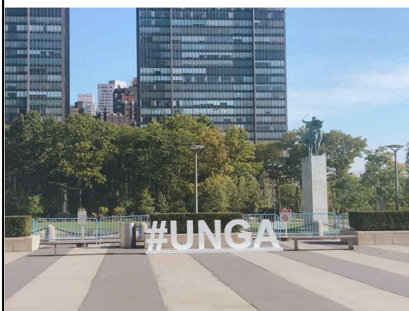
UN 본부 외관