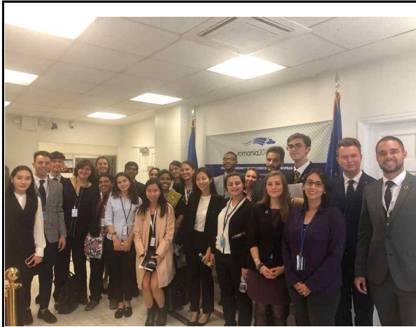
로마니아 YD 사이드 이벤트 기념사진

※ 사진 자료는 " 2.활동사진 " 부분에 최소 12매 이상(페이지 당 6매) 삽입하되, 사진 한 장당 용량은 500KB로 조정하고 각 사진 하단부에 간략한 설명을 넣을 것.