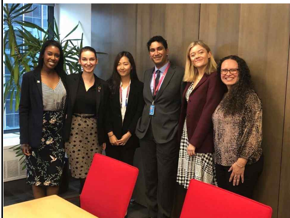
스위스&스웨덴 사이드이벤트 주최자&연설자