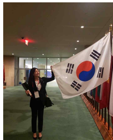
UN 사무국 빌딩, 대한민국 국기 앞에서